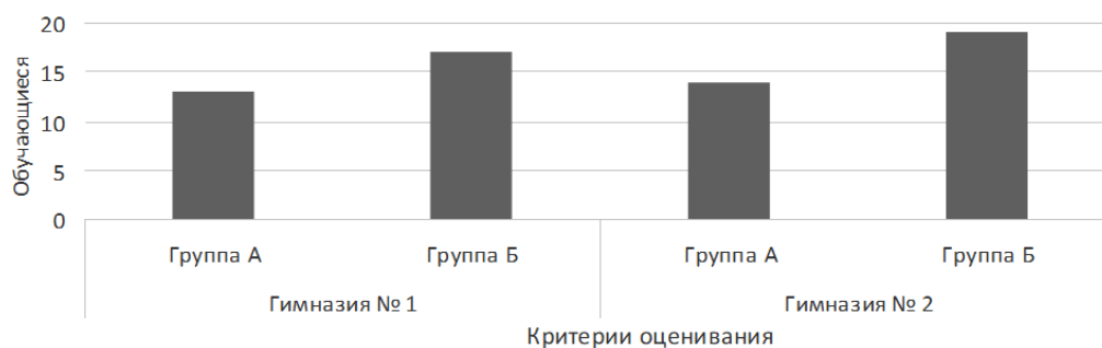
Рис. 2. Результаты констатирующего теста в контрольной и экспериментальной группах

После проведения итогового диагностического теста было выявлено, что результаты в контрольных группах (А) Гимназии № 1 (13) и Гимназии № 2 (15) не продемонстрировали существенного изменения в знаниях обучающихся обоих языков. Показатели экспериментальных групп (Б) обеих гимназий оказались значительно выше показателей контрольных групп (А). Было за-