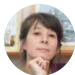
Автор Наталья БОГДАНОВА

Вот так (см. выше) выглядела передовица первого номера газеты «Политехник» – статья, в которой редакция заявляла о своих намерениях открыто говорить обо всём, что волнует студенчество (оригинальный стиль, орфография и пунктуация сохранены).