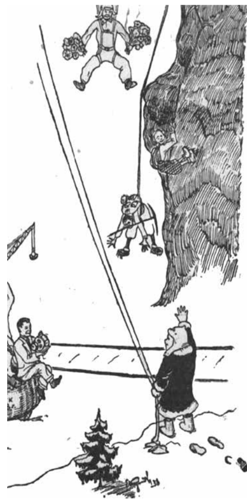
Рис. «Политехник» от 1.01.1939 г.