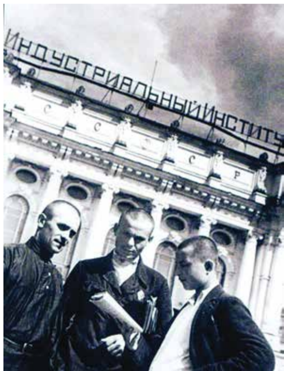
Студенты 30-х годов

К началу сороковых годов популярным стал лозунг: