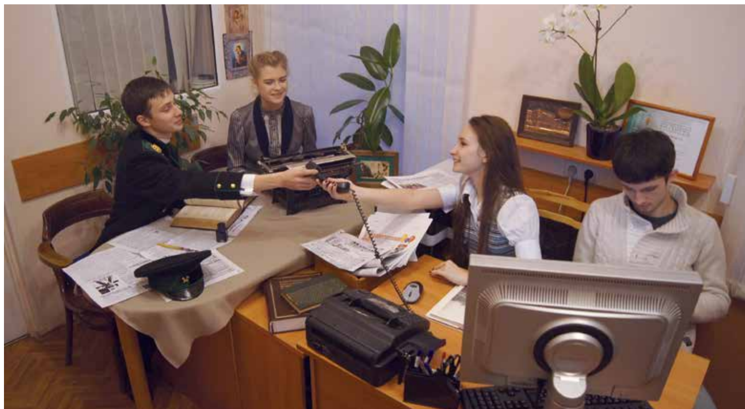
«Встреча двух эпох» в бывшем кабинете редакции № 332 в первом учебном корпусе

О том, насколько успешна была общественная деятельность, как влияла политика на жизнь института и что занимало студенческие умы столетие назад, читайте на следующих полосах.