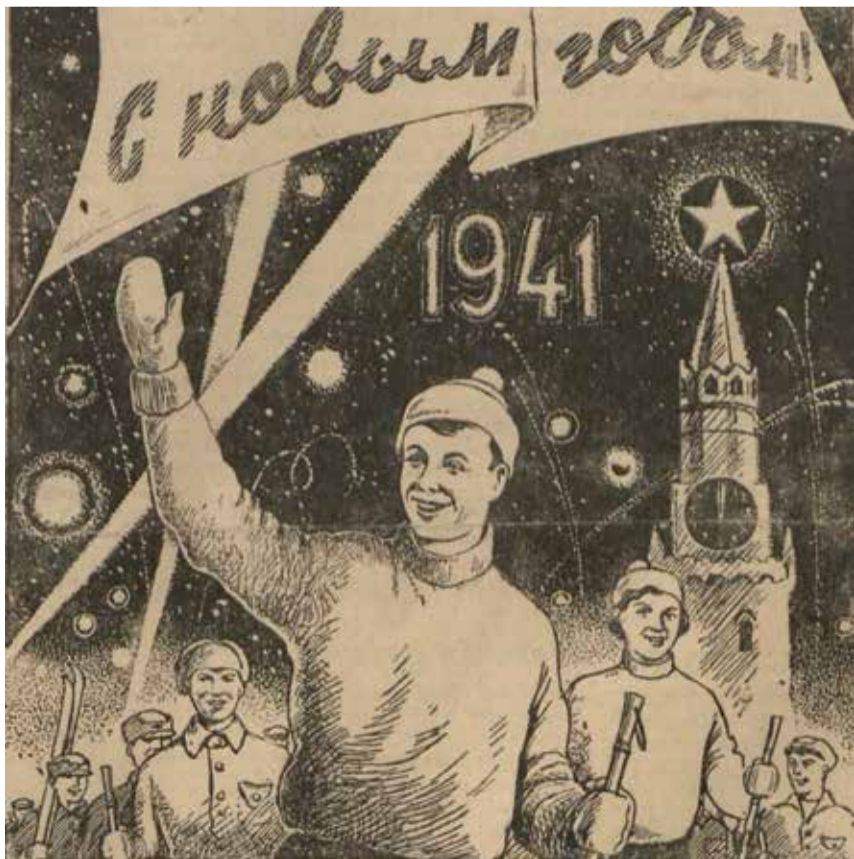
Рис. «Политехник» от 1.01.1941 г.