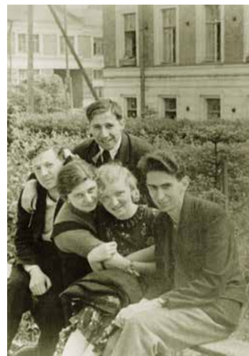
Студенты предвоенной поры

В газете подробно освещались вопросы восстановления институтского хозяйства. В заметке «На уборку снега» читаем: «Приказом директора института к работам по очистке от снега проспекта и территории института, перевозке топлива и другим мероприятиям привлекаются студенты. Все