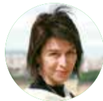
Автор Екатерина ЕФИМОВА

Если вам случится почитать старые подшивки газеты «Политехник», вы будете удивлены. Вопреки сложившемуся мнению о том, что раньше журналисты были зашоренными и писали советскими штампами, а сейчас раскрепощённые и пишут лихо и «живенько», всё ровно наоборот. Да, мощные идеологемы действительно присутствуют на страницах газеты 50–80-х годов, но в целом газетный стиль был легче, проще и интереснее, чем сейчас, когда сплошные «в ходе публичного выступления», «в рамках концертной программы» и прочие канцеляризм губят журналистские тексты.