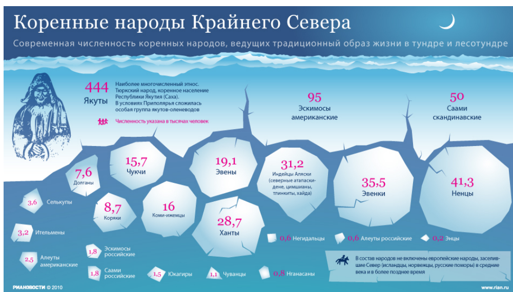
Рис.2 – Современная численность КНС

Анализируя традиционный уклад малых народов, и их интересную и самобытную культуру, хочется разделить мнение Льва Гумилева о том, что эта культура, с точки зрения этногенеза, относится к реликтовым.