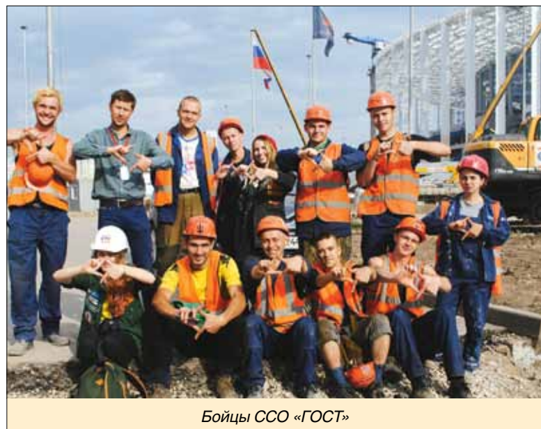
Бойцы ССО «ГОСТ»

180 вожатых-политехников провели каникулы вместе с детьми. В составе педагогических отрядов «Алые Паруса», «Созвездие», «Рассвет» и «Юность» они зажигали своей энергией мальчишек и девчонок в лагерях Ленинградской области, а СПО «Легенда»