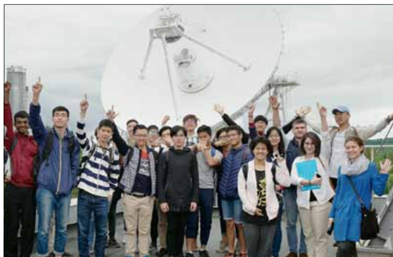
Летняя школа в радиоастрономической обсерватории «Светлое»