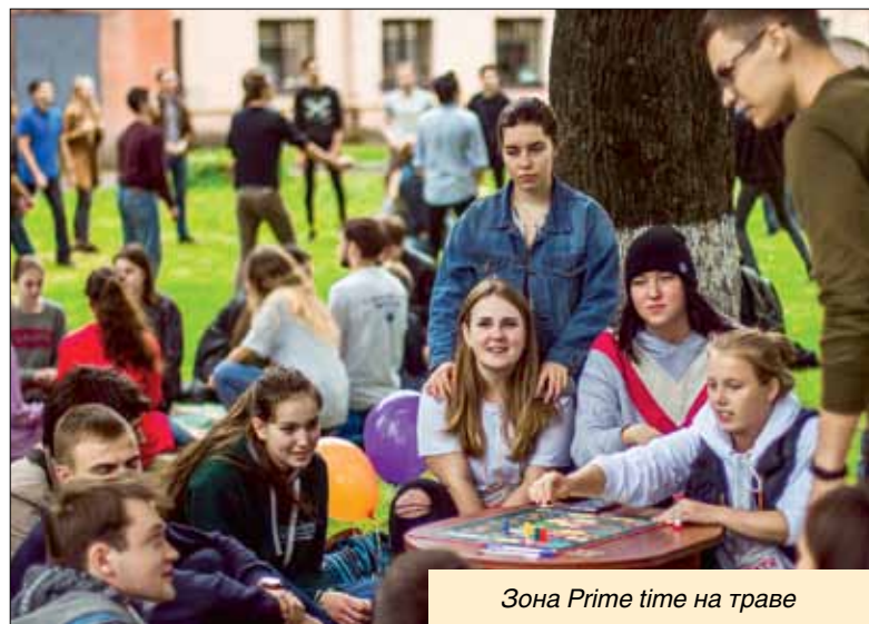
Зона Prime time на траве

Грандиозный Open Air дал старт работе студенческих объединений. Политехники познакомились с многочисленными титулованными студентами нашего Студклуба.