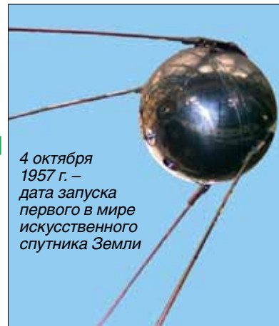
4 октября 1957 г. – дата запуска первого в мире искусственного спутника Земли