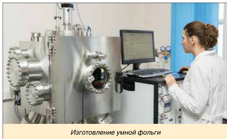
Изготовление умной фольги