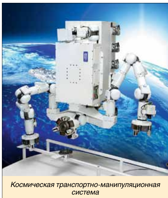
Космическая транспортно-манипуляционная система

Проблема жизнеобеспечения и контроля герметичности космических аппаратов приобрела особое значение после гибели в конце июня 1971 г. космонавтов Г.Т. Добровольского, В.Н. Волкова и В.И. Пацаева. Это было актуально и для запланированной тогда стыковки кораблей «Союз» (СССР) и «Аполлон» (США).