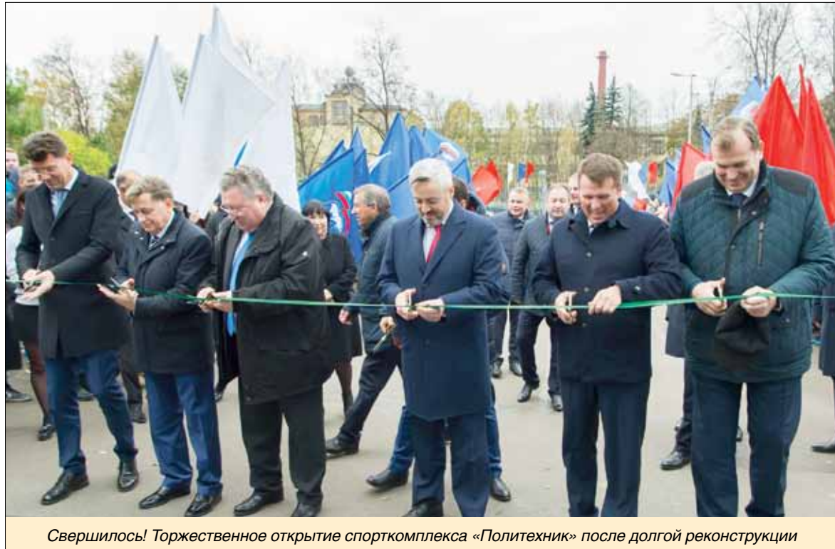
Свершилось! Торжественное открытие спорткомплекса «Политехник» после долгой реконструкции

На заседании Совета по повышению международной конкурентоспособности российских вузов среди ведущих мировых научно-образовательных центров СПбГУ представил и успешно защитил «Дорожную карту» на 2018-2020 годы. Программа повышения конкурентоспособности СПбГУ получила высокую оценку международных экспертов, и вуз вошел в первую десятку университетов Проекта 5-100.