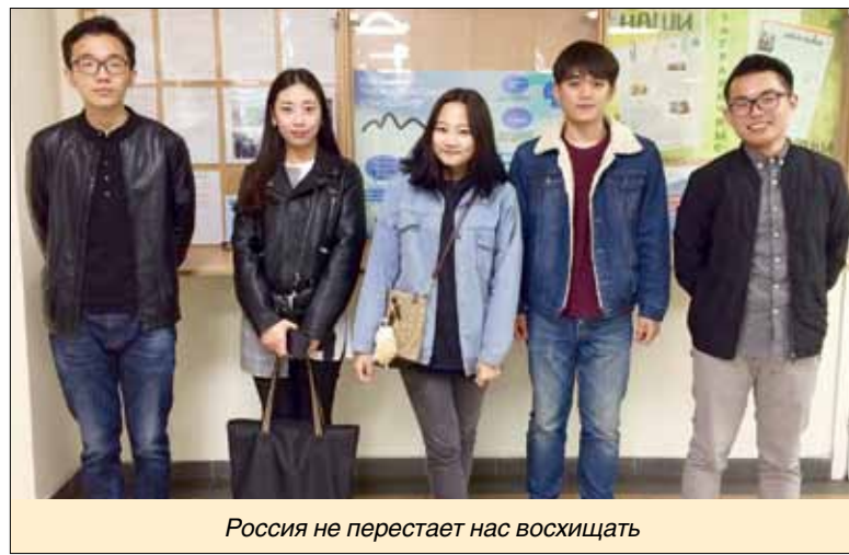
Россия не перестает нас восхищать