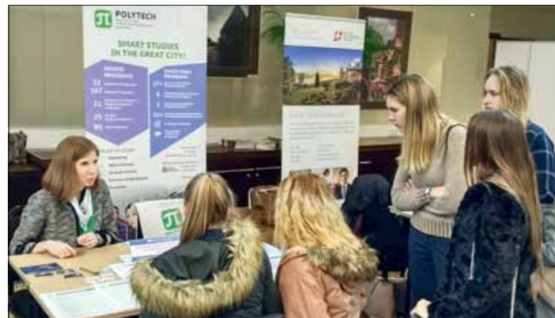
На выставке «Дни международного образования» у стенда СПбПУ всегда было многолюдно

СПбПУ – традиционный участник крупнейшей в Балтии (Латвия, Литва, Эстония) специализированной выставки «Дни международного образования».