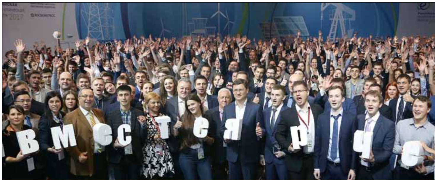
Такие масштабные по количеству участников встречи – отличная площадка для роста молодых энергетиков