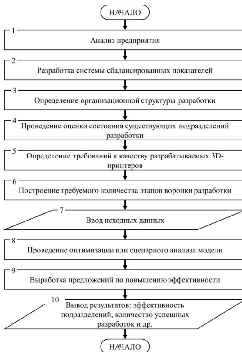
Рисунок 3 – Алгоритм построения и работы с имитационной моделью

В четвертой главе «УСЛОВИЯ РЕАЛИЗАЦИИ МЕТОДОВ И МОДЕЛЕЙ ПЛАНИРОВАНИЯ И ОПЕРАТИВНОГО УПРАВЛЕНИЯ ПРОЦЕССАМИ РАЗРАБОТКИ ЭКСТРУЗИОННЫХ 3D-ПРИНТЕРОВ» рассмотрены условия организации экструзионных 3D-принтеров на конкретном предприятии (ООО «Компания ИМПРИНТА») и представлены результаты практического применения полученных результатов в рамках диссертационного исследования. Разработана и апробирована имитационная модель планирования и управления процессами создания экструзионных 3D-принтеров требуемого качества.