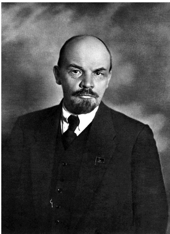
Рисунок 5 Ленин В.И.

Российский революционер, советский политический и гос. деятель, создатель Российской социал-демократической рабочей партии (большевиков), один из главных организаторов и руководителей Октябрьской революции 1917 года в России, первый председатель Совета Народных Комиссаров (правительства) РСФСР, создатель первого в мировой истории социалистического государства.