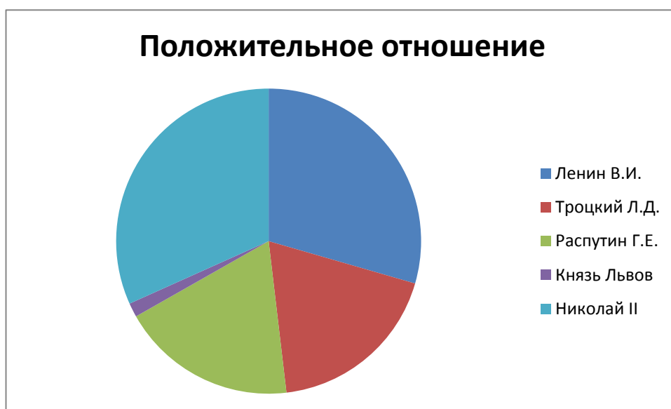
Рисунок 7 Отношение студентов к героям истории

Как и было ожидаемо, результаты оказались крайне противоречивыми. Это, в первую очередь, связано с невозможностью студентов точно определиться с их позицией. Недостаток знаний играет не столь значимую роль в этом вопросе, куда более важна реальная путаница в исторических справках, что сбивает с толку даже опытных экспертов.