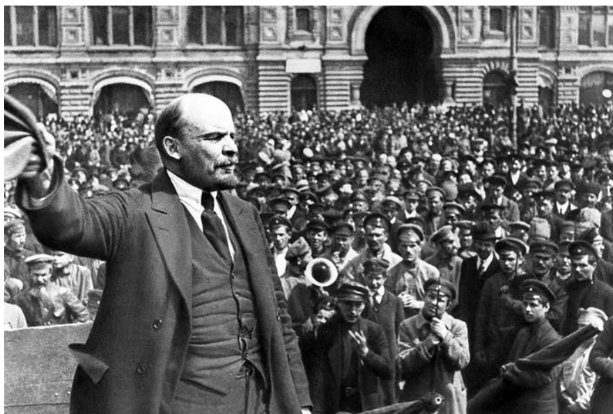
Рисунок 1 В.И.Ленин на Красной площади

“Революция (от позднелатинского «revolutio» — поворот, переворот, превращение, обращение) — радикальное, коренное, глубокое, качественное изменение, скачок в развитии общества, природы или познания, сопряжённое с открытым разрывом с предыдущим состоянием”