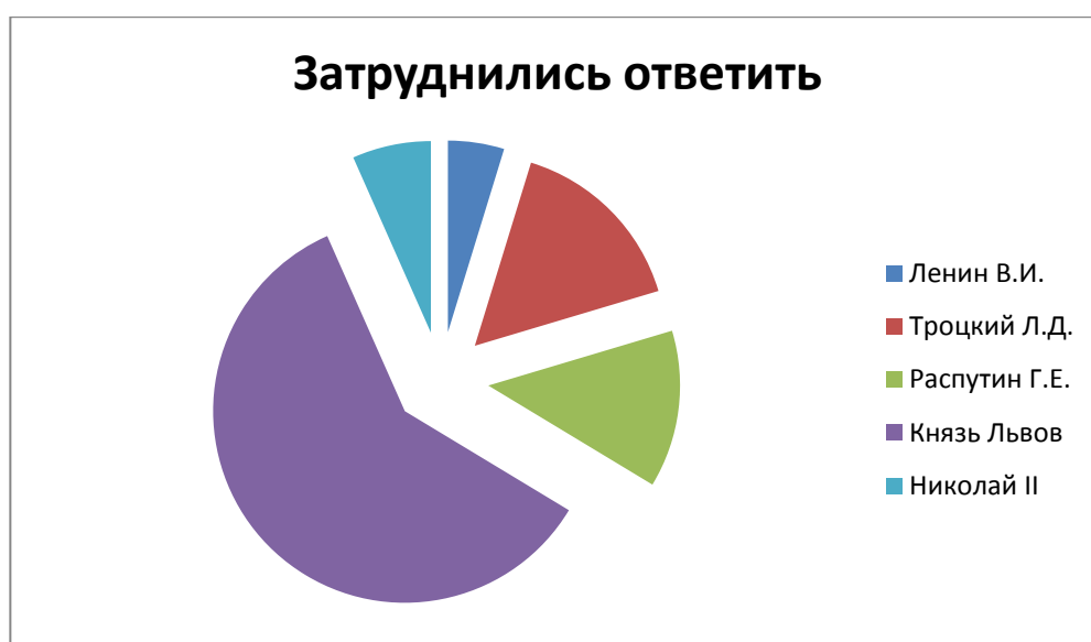
Рисунок 9 Круговая диаграмма

Однако особого внимания требует результат по Князю Львову. 126 человек из 150 затруднились дать ту или иную оценку. Это говорит о том, что из предложенных вариантов, личность Князя Львова наиболее неизвестна опрашиваемым. Действительно, ссылаясь на исторические события, многие эксперты, как правило, обсуждают наиболее крупных и знаменательных деятелей, и лишь некоторые ищут зависимости и тесную связь между теми, кого история знает хорошо, и теми кто оставался в тени, но имел существенное влияние на деятельность целых государств. Князь Львов не является теневой фигурой, как раз наоборот, но то, что история порой обходит его и личности многих других деятелей стороной, и отражается на таких результатах опроса.