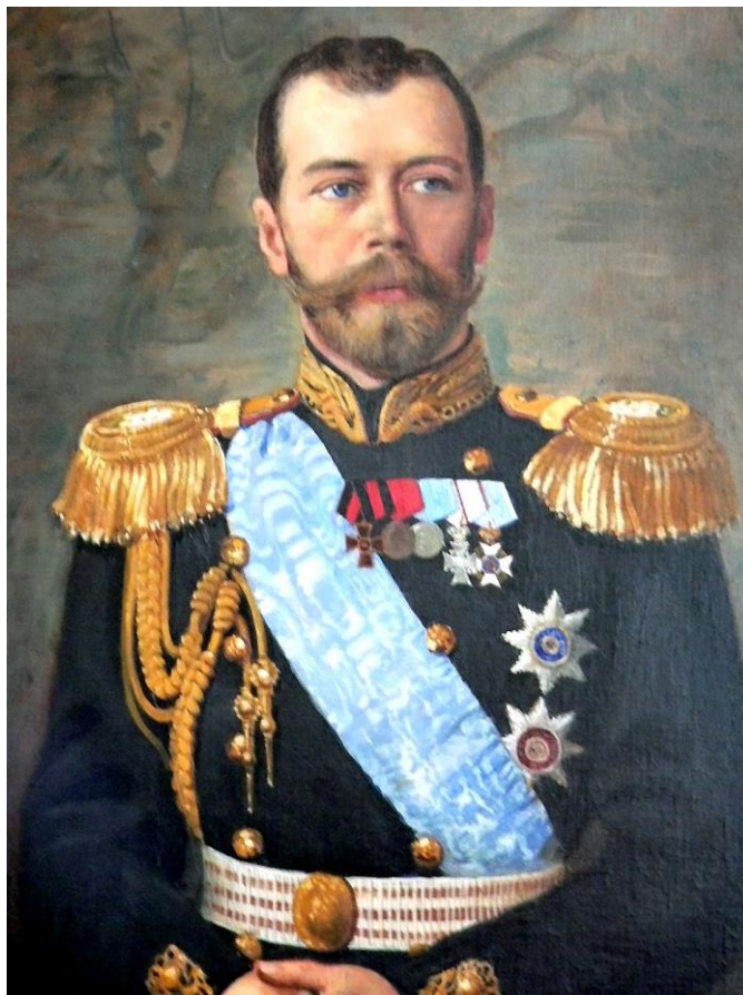
Рисунок 2 Николай II

Отрёкся от престола в ходе Февральской революции 1917 года и находился вместе с семьёй под домашним арестом в Царскосельском дворце. Летом 1917 года по решению Временного правительства был вместе с семьёй отправлен в ссылку в Тобольск, а весной 1918 года перемещён большевиками в Екатеринбург, где в июле 1918 года был расстрелян вместе с семьёй и приближёнными.