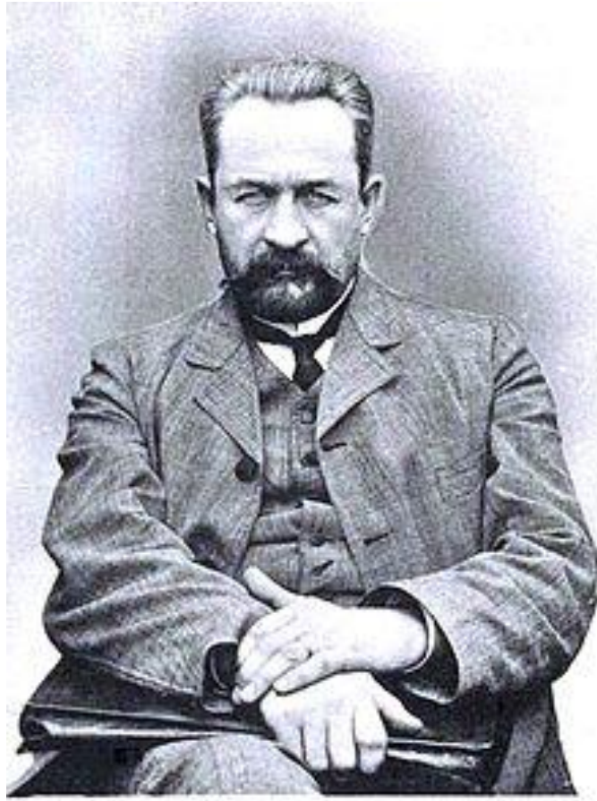
Рисунок 4 Князь Львов

Русский общественный и политический деятель; 2 марта во время Февральской революции был назначен императором Николаем II главой Временного правительства (фактически главой государства).