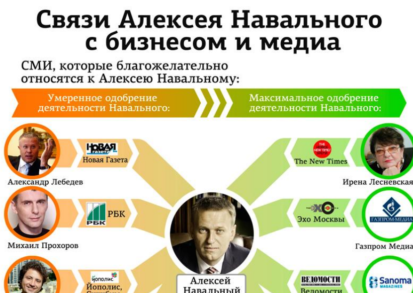
Рисунок 10 Информационная поддержка Алексея Навального

Приведем в пример данные о том, какие СМИ поддерживают Алексея Навального: