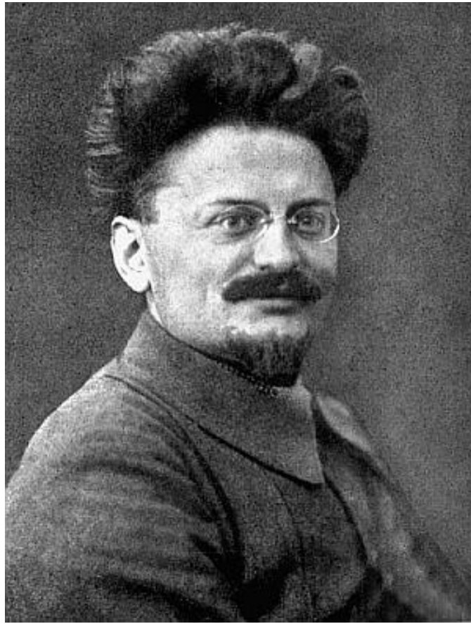
Рисунок 6 Троцкий Л.Д.

Революционный деятель XX века, идеолог троцкизма — одного из течений марксизма. Дважды ссыльный при монархическом строе, лишённый всех гражданских прав в 1905 году. Один из организаторов Октябрьской революции 1917 года, один из создателей Красной армии. Один из основателей и идеологов Коминтерна, член его Исполкома.