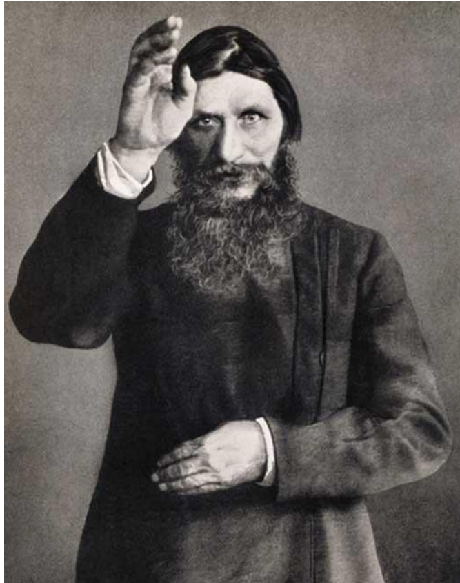
Рисунок 3 Распутин Г.Е.

Приобрёл всемирную известность благодаря тому, что был другом семьи российского императора Николая II. В 1910-е годы в определённых кругах петербургского общества имел репутацию «царского друга», «старца», прозорливца и целителя. Негативный образ Распутина использовался в революционной, позднее, в советской пропаганде.