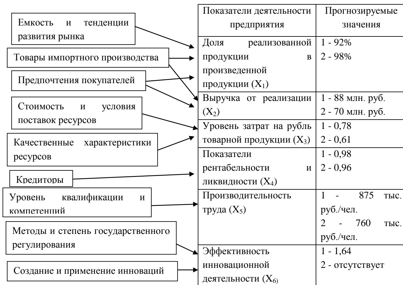
Рис. 3. Совокупность показателей, влияющих на адаптацию стратегии, на примере ООО «Полипласт»

В результате расчетов максимальное значение было получено для стратегии, предусматривающей развитие интеллектуального потенциала, позволяющей создавать инновации и расширять долю рынка.