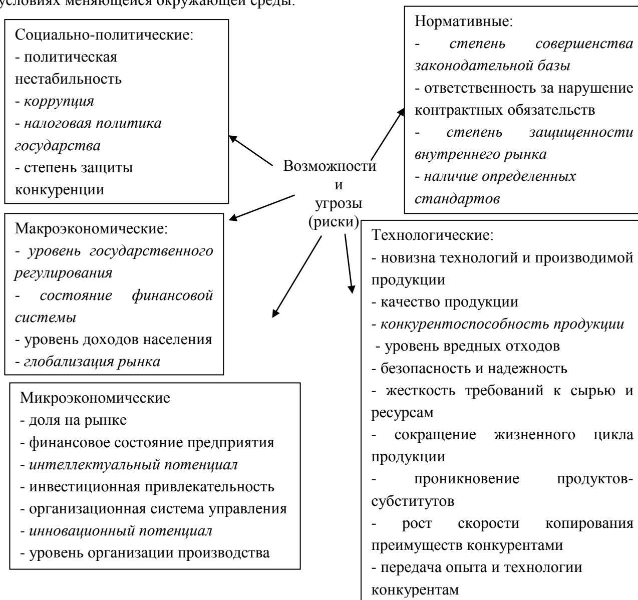
Рис. 1. Основные возможности и угрозы деятельности промышленных предприятий

Выявленные особенности определяют необходимость разработки новой стратегии в условиях меняющейся окружающей среды.