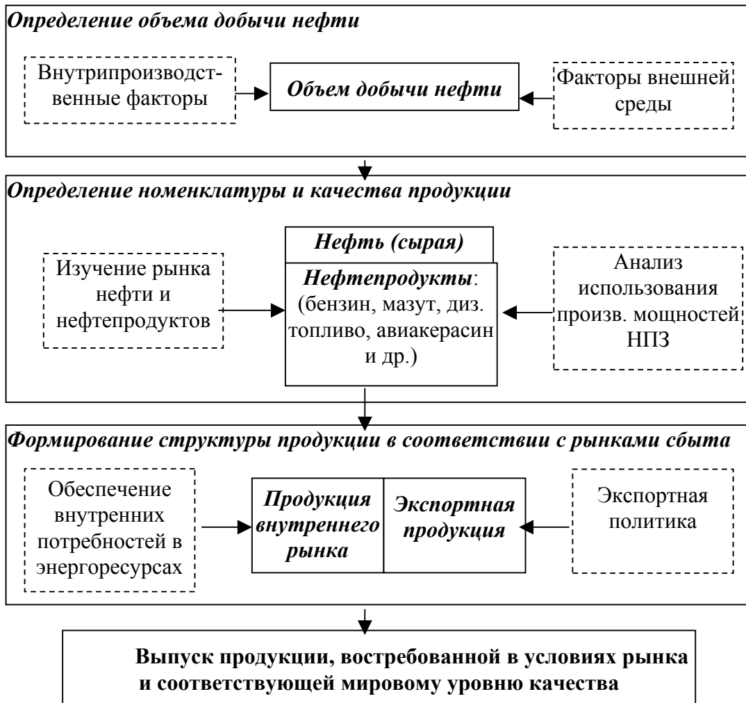
Рис. 5. Процедура расчета выпуска продукции нефтяной компанией

- экспортной квоты – нижнее ограничение и ограничений по пропускным возможностям экспортных терминалов – верхнее ограничение (формула 6).