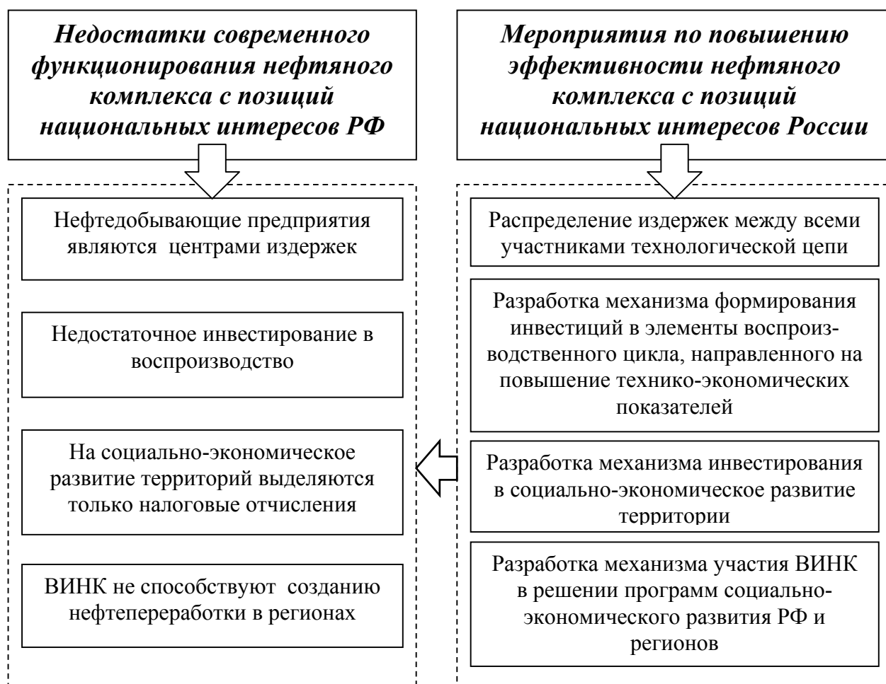
Рис. 3. Мероприятия по повышению эффективности функционирования нефтяного комплекса с позиций национальных интересов России

интересов России (рис. 3.) и отвечающих сформулированным организационно-экономическим принципам развития нефтяного комплекса.