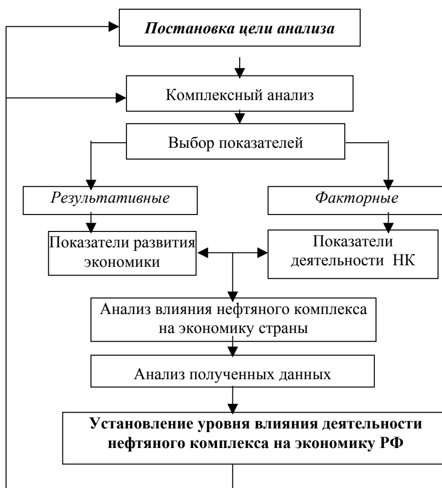
Рис. 1. Алгоритм оценки влияния деятельности нефтяного комплекса на экономику РФ

Автором предложен алгоритм оценки влияния деятельности нефтяного комплекса России на экономику страны, в основу которого заложен механизм определения тесноты связи между макроэкономическими показателями и показателями деятельности нефтяного комплекса с помощью корреляционно-регрессионного анализа (рис. 1).