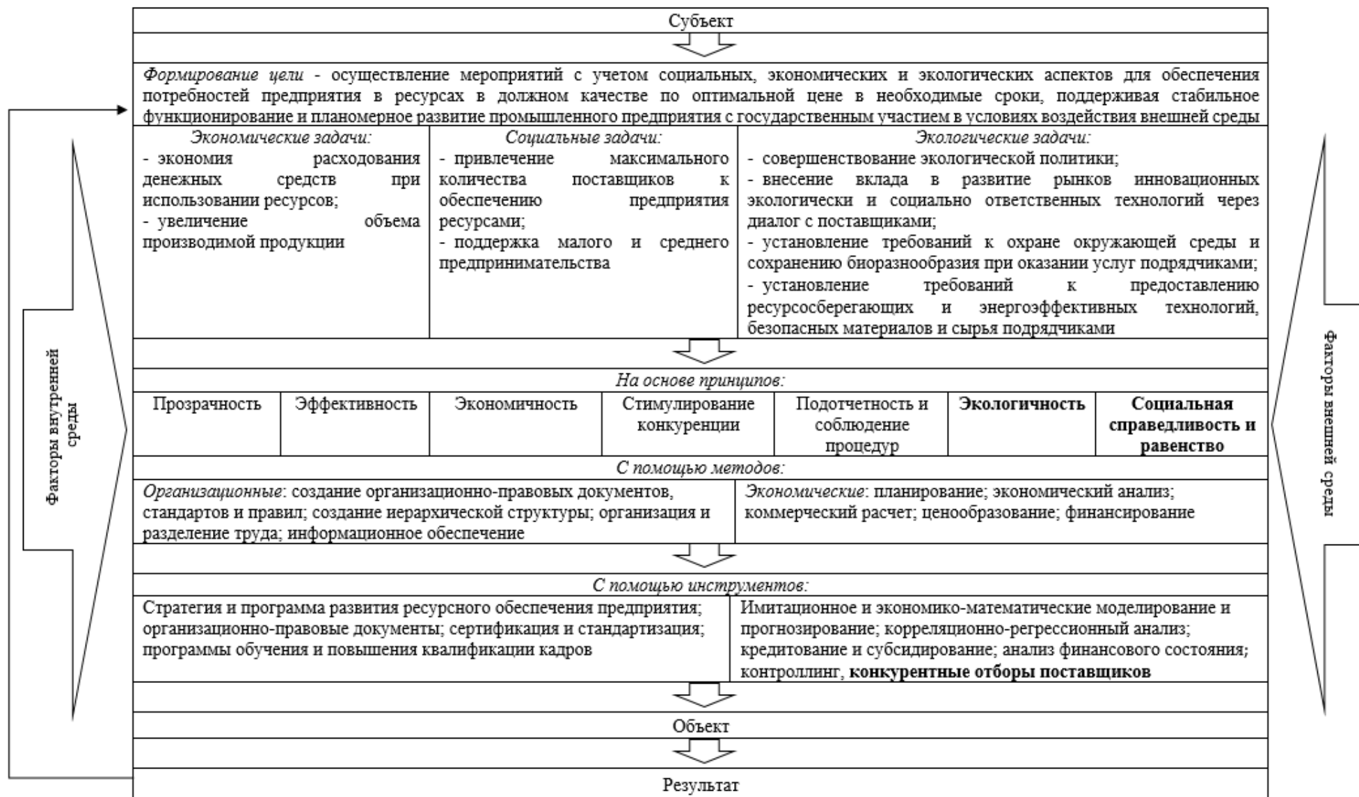
Рисунок 2. Организационно-экономический механизм устойчивого ресурсного обеспечения промышленного предприятия с государственным участием (составлено автором)