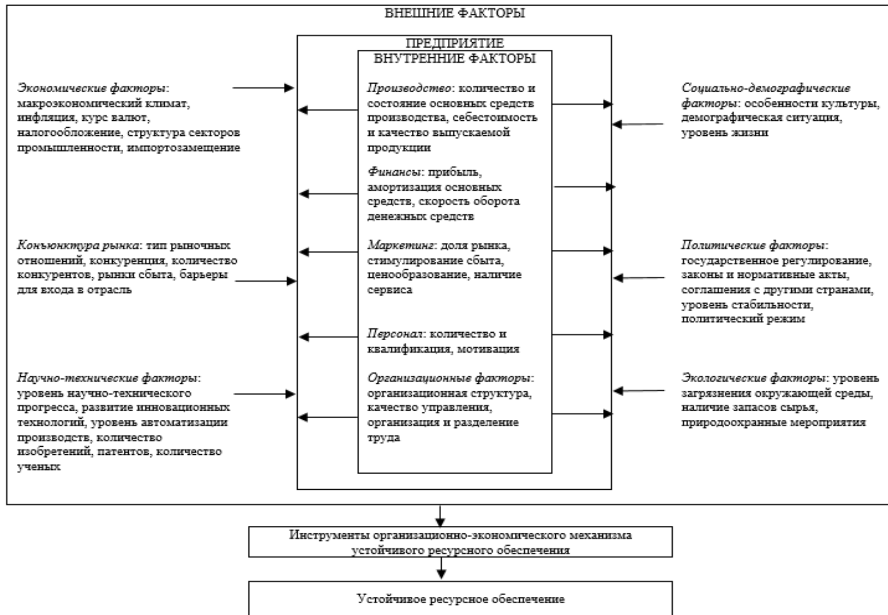
Рисунок 1. Внешние и внутренние факторы устойчивого ресурсного обеспечения промышленного предприятия с государственным участием (составлено автором)