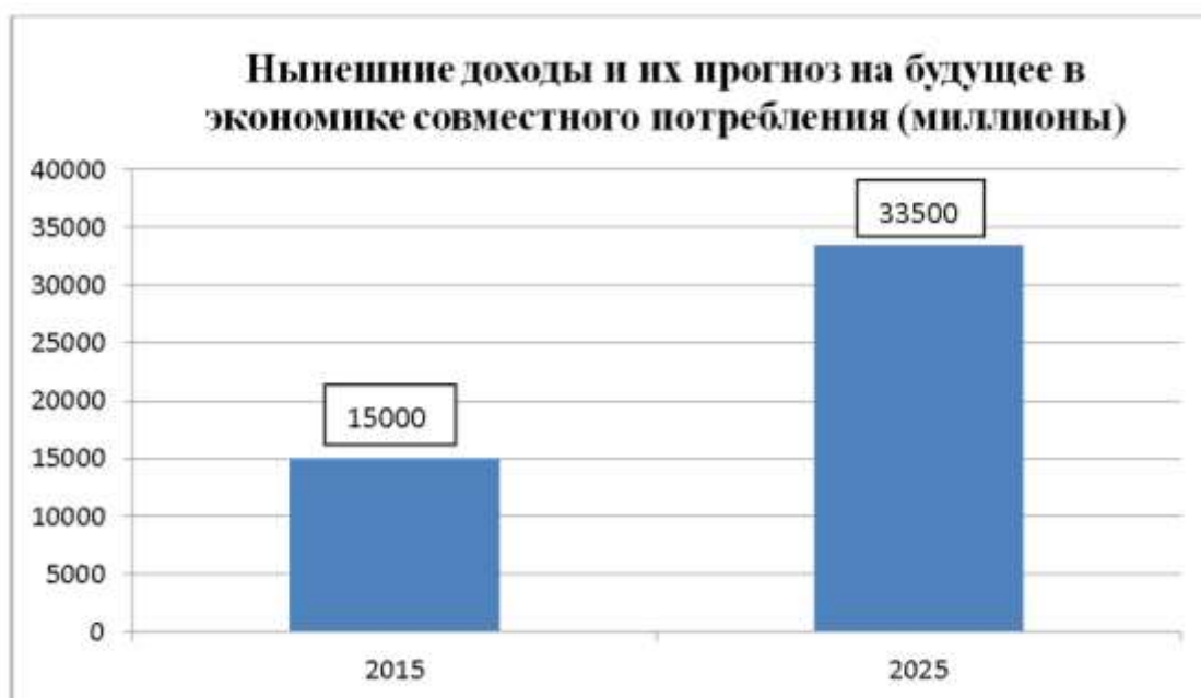
Рис. 1. Прогноз роста доходов секторов экономики совместного потребления, млн. долларов.

Согласно отчету «Платформы экономики совместного потребления: глобальный взгляд» от издательства «Ostelea Centro Universitario Internacional», специализирующегося на обучении лидеров и техниках индустрии гостиничного дела и туризма, имеющего штаб-квартиру в Барселоне, предполагается, что пятью основными секторами экономики совместного потребления являются следующие: туризм, транспорт, финансы, посредничество в трудоустройстве и развлечения. Кроме того, предполагается, что данные сектора повысят свои доходы в глобальном масштабе на 335 000 млн. долларов до 2025 года в сравнении с 15 000 миллионами, официально зарегистрированными в 2015 году. Это будет увеличение более чем на 2 000% всего за 10 лет