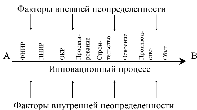
Рис. 1. Неопределенность первого рода

Неопределенность первого рода не позволяет с уверенностью гарантировать достижение планируемого результата, обозначенного на рисунке 1 точкой В.