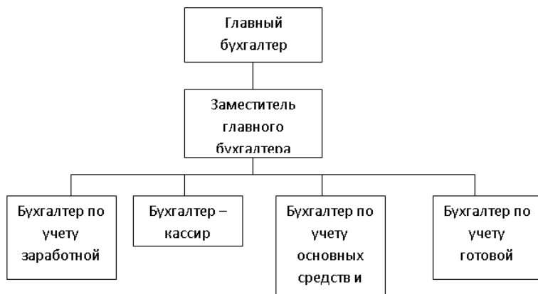
Рисунок 2.1 - Структура бухгалтерии ОАО «ОЗМК»

Бухгалтерский учет на предприятии осуществляется специализированным подразделением бухгалтерии, структура которой представлена на рисунке 2.1.