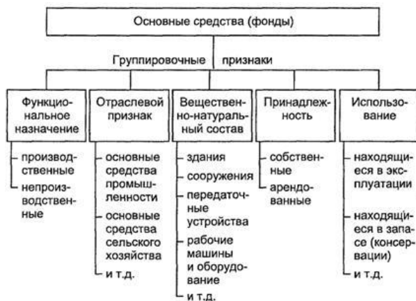
Рисунок 1.1 - Классификация основных средств (фондов)

По принципу вещественно натурального состава они систематизируются на: здания, сооружения, передаточные устройства, рабочие и силовые машины и оснащения, мерительные и регулирующие приборы и устройства, вычислительная техника, транспортные средства, инструмент, производственный и хозяйственный инвентарь и приспособления, рабочий и продуктивный скот, многолетние насаждения, внутрихозяйственные дороги и прочие основные средства, а также земельные участки, находящиеся в собственности фирмы, учреждения.